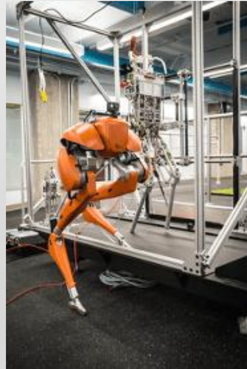
二足歩行ロボット